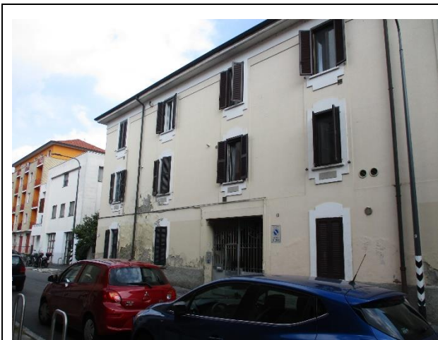
Fabbricato- facciata esterna

Principali collegamenti pubblici: autobus di linea 45-175