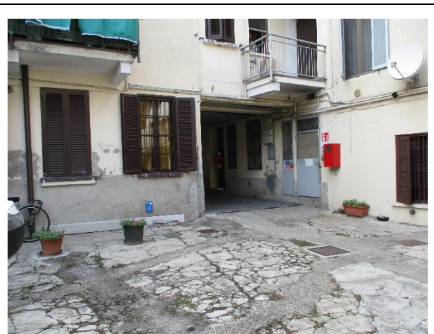
fabbricato- cortile interno